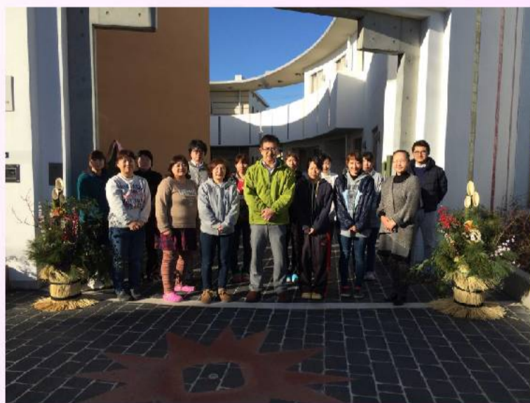
「あいむ」職員全員で記念撮影