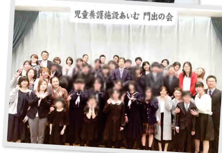
児童養護施設あいむ 門出の会