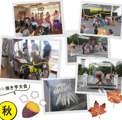
イベント当日までのお楽しみ♡